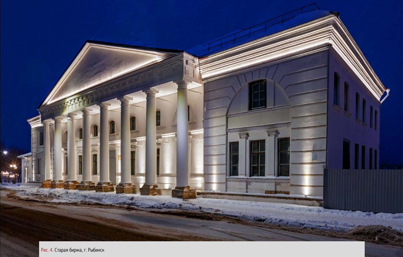
Рис. 4. Старая биржа, г. Рыбинск

Архитектурно-художественные светильники бренда Raduga обладают хорошей энергоэффективностью – более 110 лм/Вт. За счет высокого показателя индекса цветопередачи, более 80 CRI, достигается максимально реалистичное отображение цвета фасада. Широкая модификация угла раскрытия позволяет использовать одни и те же приборы в разных вариациях: на колоннах при необходимости производится установка оборудования с узким пучком раскрытия, для карнизов и межконных простенков характерно применение подсветки эллипсоидной оптики, достигающей высокой плотности заливки. Небольшие габариты и малая масса светильников Raduga позволили установить все светотехнические приборы даже в зонах сложной декоративной отделки, в местах изразцовой плитки. Благодаря высокой степени защиты и широкому диапазону рабочей температуры светильники устанавливаются даже на набережных с максимально влажным и примесным воздухом.