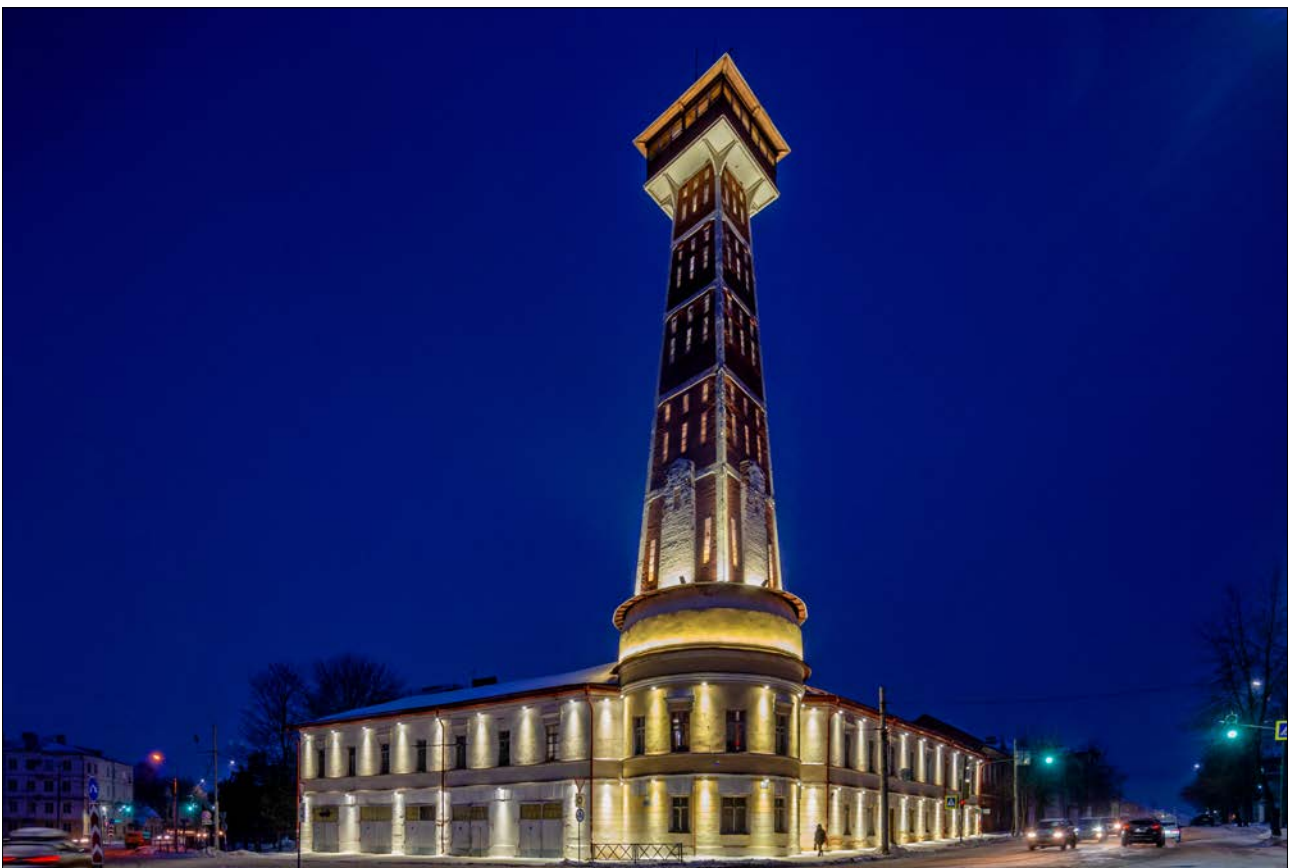
Рис. 2. Пожарная каланча, г. Рыбинск

Новая хлебная биржа – одна из главных достопримечательностей города, настоящий шедевр архитектуры XX века. Оно представляет собой огромный замок, построенный на берегу на самой видовой точке Рыбинска. Здание поражает своими архитектурными элементами, габаритами и богатством отделочных материалов. Фасады строения украшены несколькими сотнями израз-