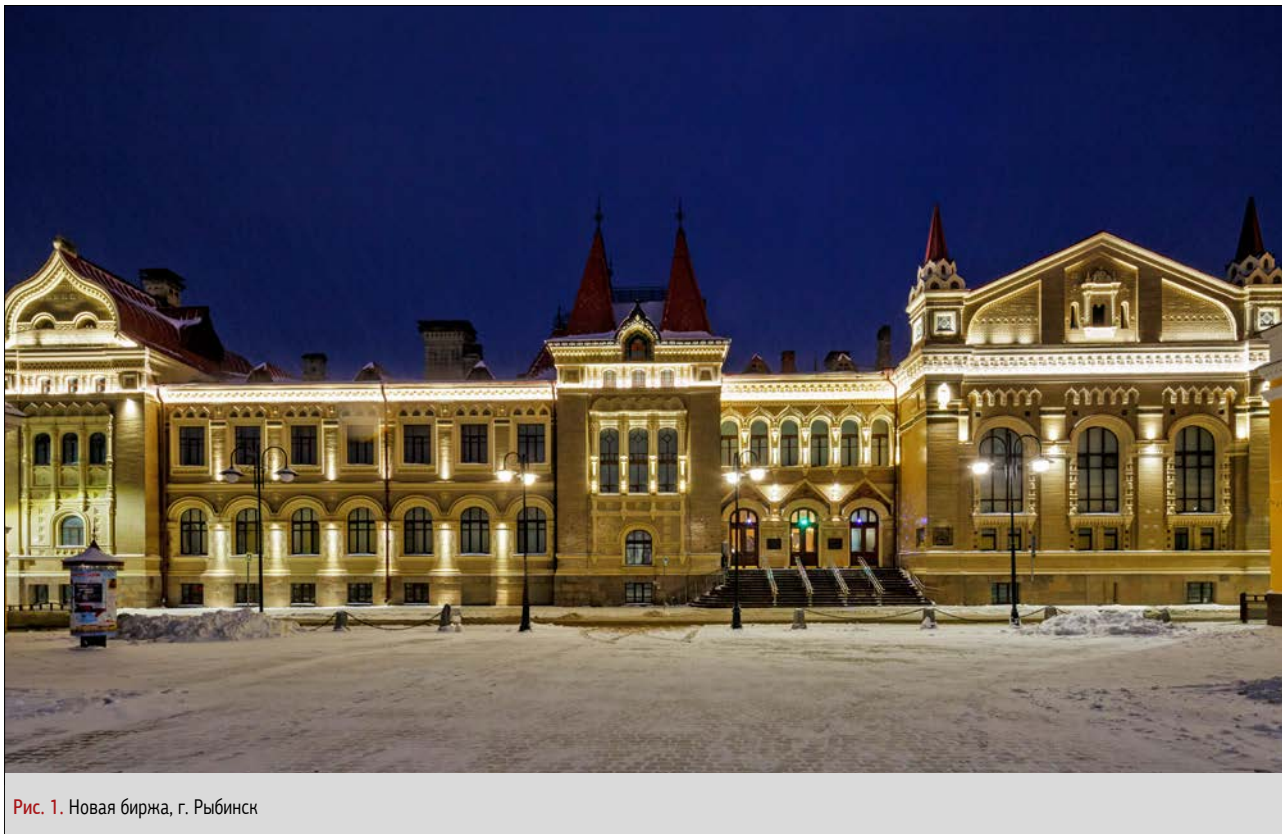
Рис. 1. Новая биржа, г. Рыбинск